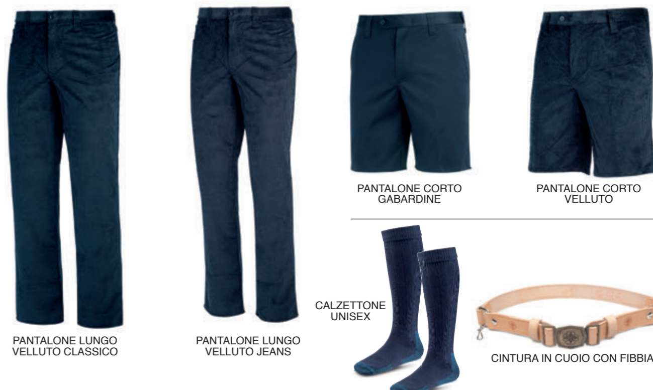
PANTALONE LUNGO VELLUTO CLASSICO